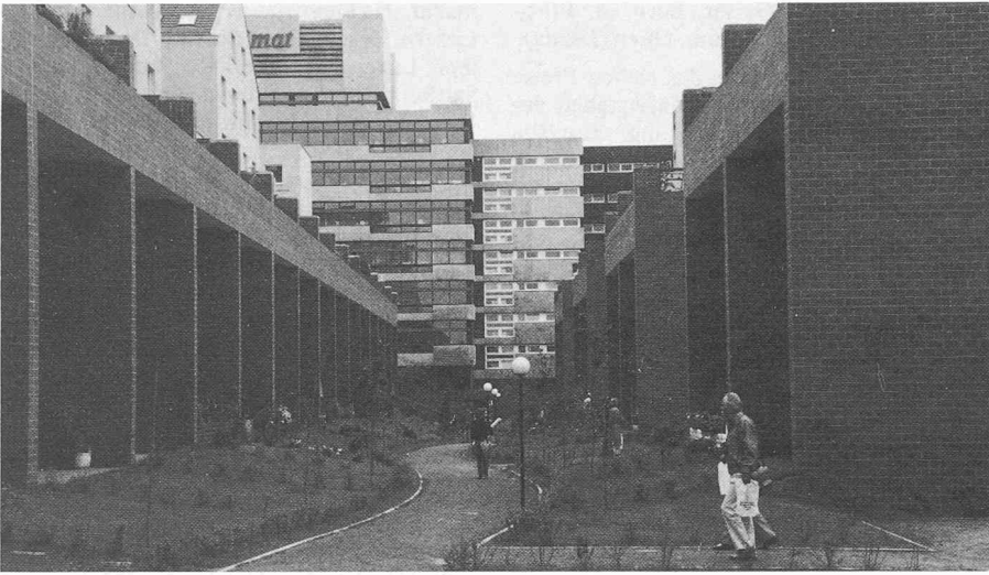
Lützowplatz West, Hofansicht, «Introvertiertes Wohnen»: O. M. Ungers

sitionen innerhalb der Bauverwaltung innehatten: Langhans war über Jahre Leiter des Oberhofbauamtes; Gilly zwischen 1788 und 1790 immerhin dort Kondukteur; Schinkel war schon 1810, also neunundzwanzigjährig, Assessor in der Baudeputation und fünf Jahre später Geheimer Oberbaurat; Wagner von 1926 bis 1933, in einer für Berlin entscheidenden Zeit, Stadtbaurat. Derlei brillante Persönlichkeiten vermochten somit revolutionäre Ideen zu gebären, auszuarbeiten und innerhalb einer umfassenden Stadtpolitik auch durchzusetzen; ihr Beitrag beschränkte sich nicht auf einzelne aufsehenerregende Bauten, sondern umfasste den städtischen Organismus als Ganzes. Später fielen solche Ideen den Leuten in den «falschen» Positionen ein, wo sie Papier blieben oder bestenfalls in zu kleinem Massstab realisiert wurden; gleichzeitig versumpfte die Stadtentwicklung im zähen bürokratischen Schlamm oder blieb im kurzatmigen Legislaturperiodendenken der Berufspolitiker stecken.