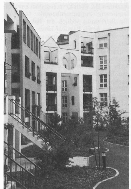
Wohnüberbauung Ritterstrasse, Innenhof: Rob Krier

Das ehrgeizige Unternehmen wurde und wird von vielen mit grösster Skepsis verfolgt. Man will in der IBA die Fehler der Interbau wiedererkennen: Grosse Namen sollten gute Architektur garantieren und überdies die Kontinuität des Berliner Bauens wahren. Beides kann man wohl kaum haben, und die Kontinuität ist – glaube ich – längst gebrochen. Ich bin aber trotzdem zuversichtlich. Auch wenn nicht alle Höhenflüge, die im Überschwang des Beginnens zu Papier gebracht, sich verfestigen und in die Annalen der Architekturgeschichte eingehen werden, so dürften doch wesentliche Impulsträger heute schon sichtbar sein. Entscheidendes ist im Gange und wird sich hoffentlich noch zutragen. Das Berichtsjahr 1984 ist nur eine Wegmarke – mit Fernsicht auf 1987: Die 750-Jahr-Feier der Stadt Berlin ist Zielpunkt; dann wird man urteilen können, ob die IBA die Rolle spielen kann, die man ihr zugeacht hat. Bruno Odermatt