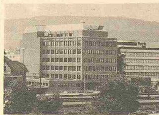
Filara-Fassade für einen Versicherungsneubau in Zürich-Altstetten