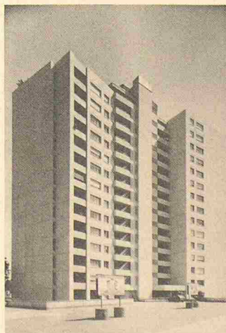
Das Ende sechziger Jahre von Alvar Aalto erbaute Hochhaus Schönbühl in Luzern wurde wärmetechnisch saniert und mit Armafил-Elementen verkleidet