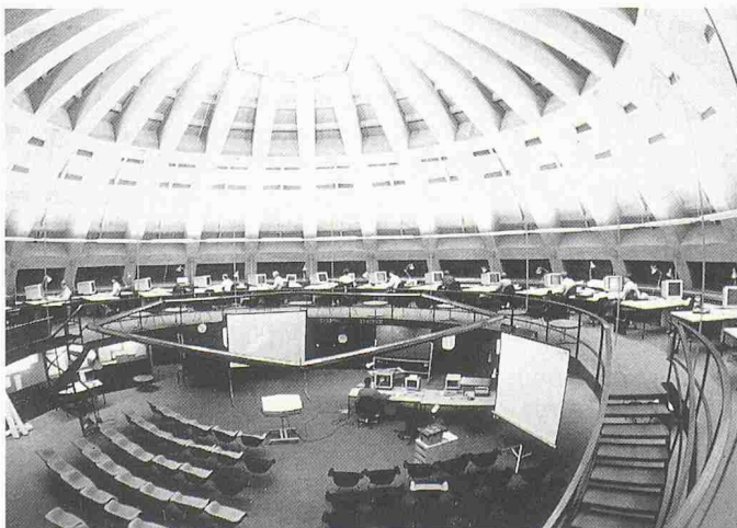
Bild 1. Das CAETH-Zentrum der ETH Zürich

Sämtliche Industrieländer unternehmen zur Zeit grösste Anstrengungen, um auf diesem Gebiet Fortschritte zur Verbesserung der Konkurrenzfähigkeit ihrer Industrie zu machen. CIM ist nicht nur anwendbar für Grossunter-