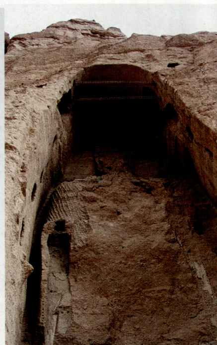
Oben links: Höhle eines mutmasslichen Bodhisattva (Anwärter einer künftigen Buddhaschaft) in Bamjyan.