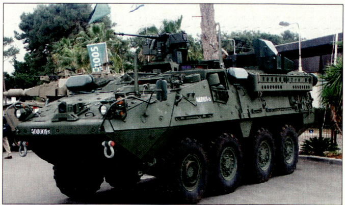
Schützenpanzer «Stryker», ausgerüstet mit dem aktiven Schutzsystem «Trophy».

Bei der Entwicklung von «Trophy» wurden sehr strenge Sicherheitsforderungen der Heeresruppen berücksichtigt. So sollen Hohl-ladungsgefechtssköpfe, vor allem auch sämtliche von RPGs verschossenen Gefechtssköpfe rechtzeitig ausgeschaltet werden, ohne wesentliche Beeinträchtigung der eigenen Fahrzeuge. Es soll nur sehr vereinzelt zu geringen Kollateralschäden gekommen sein. Einsatz-tests und Simulationen haben zudem ergeben, dass die Gefährdung von sich in der Nähe befindender eigener Infanterie oder Fahrzeugbesatzungen durch Kollateralschäden praktisch nicht vorhanden ist. Das aktive Schutzsystem «Trophy» wird u. a. auch als Zusatzschutz für die amerikanischen Schützenpanzer «Stryker» angeboten. D.E.