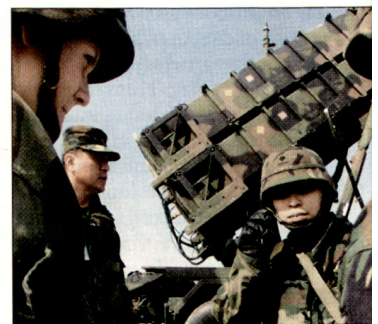
Flab-Lenk Waffensystem «Patriot» während einer Übung in Südkorea.

Ausschlaggebend für die Anstrengungen zur Verbesserung der Luftverteidigung Japans ist die nordkoreanische Raketenbedrohung. Nachdem Nordkorea 1998 eine Mittelstreckenrakete über Japan hinweg getestet hatte, beschloss Tokio unverzüglich, sich an einem gemeinsamen künftigen