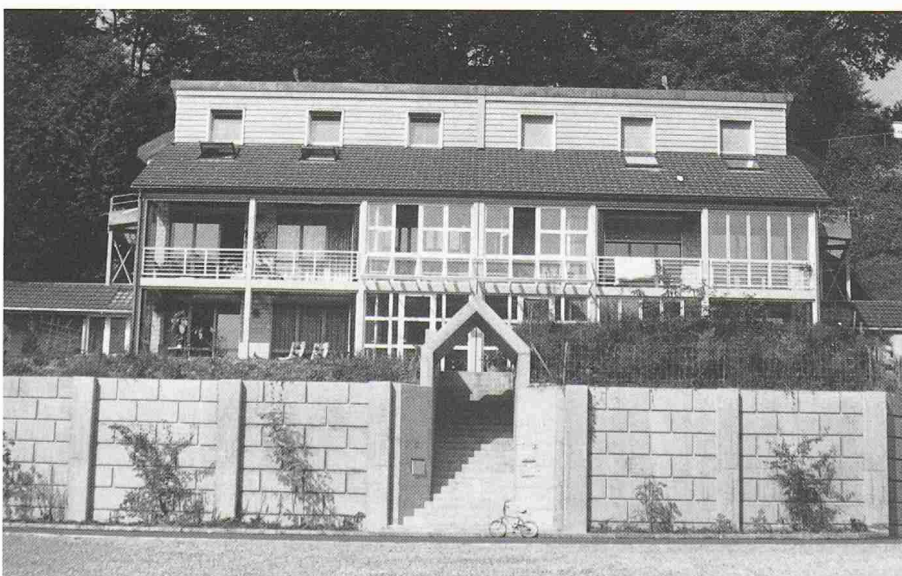
Bild 3. Doppelfamilienhaus in Wald. Die nordseitig erdbedeckten Doppelwohnhäuser mit gemeinsamen Zugang sind auf der ganzen Südfront mit verglasten zweigeschossigen Veranden ausgeführt, welche im Sommer zurückgefaltet werden können. Die Solarbauten in Wald sind tief ins Erdreich eingebettet. Die innere Vertikalzonierung (thermische Schichtung) ist von aussen ablesbar. Die verglasten Veranden sind im Sommer Balkone resp. Sitzplätze

Die Kriterien wurden nicht mit Prioritäten gewichtet. In die engere Wahl kamen aber nur Bauten, bei denen eine ausreichende Erfüllung der Kriterien 1 und 2 sowie alternativ 3 oder 4, ferner