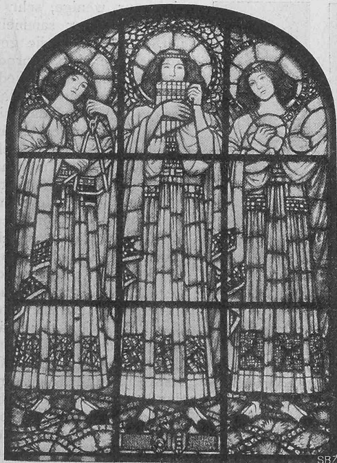
Abb. 24. Fenster der Orgelempore. Musizierende Engel.

wenige vermögen uns dauernd zu fesseln. Schon nach dem ersten Durchblättern langweilen sie uns durch ihre wahllose Ausstattung und füllen später, selten mehr aufgeschlagen, entweder den Bibliothekschränk oder zieren in den Häusern,