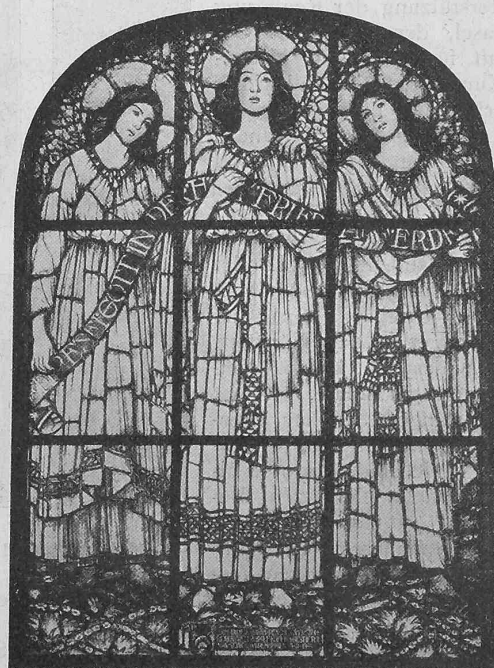
Abb. 25. Fenster der Orgelempore. Singende Engel.