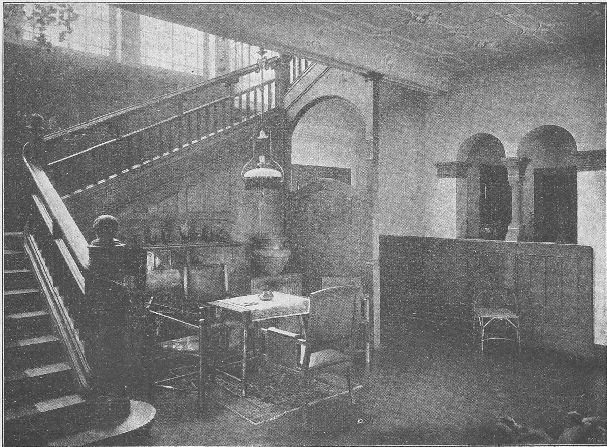
Abb. 9. Blick in die Halle gegen den Vorraum und die Treppe zum Obergeschoss.