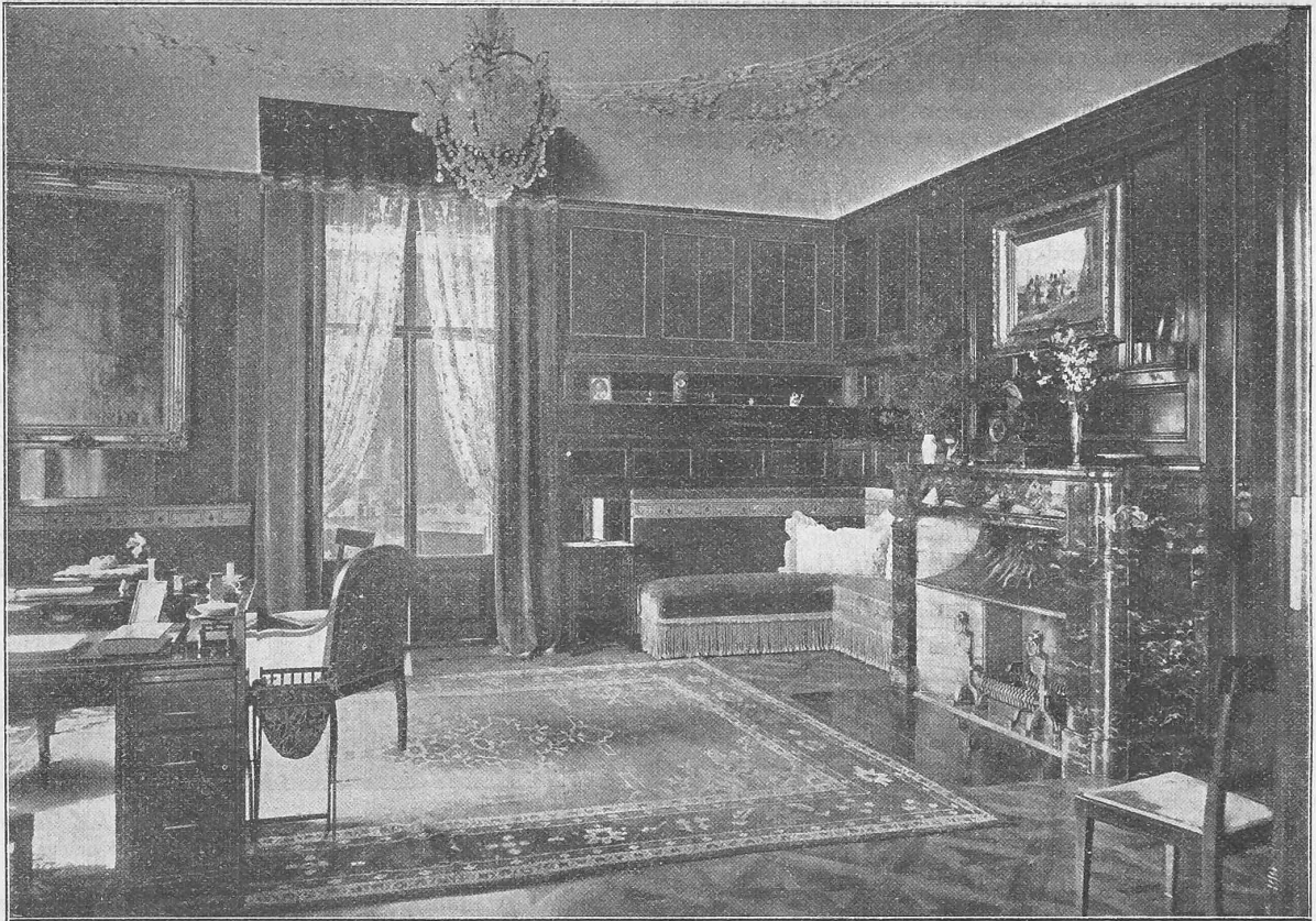
Abb. 8. Das Wohnzimmer im Erdgeschoss der Villa.