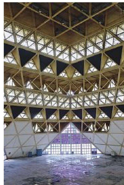
Hall of Nations in Neu Delhi (1971–72)

Mahendra Raj hat es mit Erfindungsgabe, mit Experimentierfreudigkeit und mit Improvisationstalent geschafft, aussergewöhnliche Projekte zu konzipieren und umzusetzen – sowohl als Gestalter wie als Ingenieur. Aspekte seines umfassenden