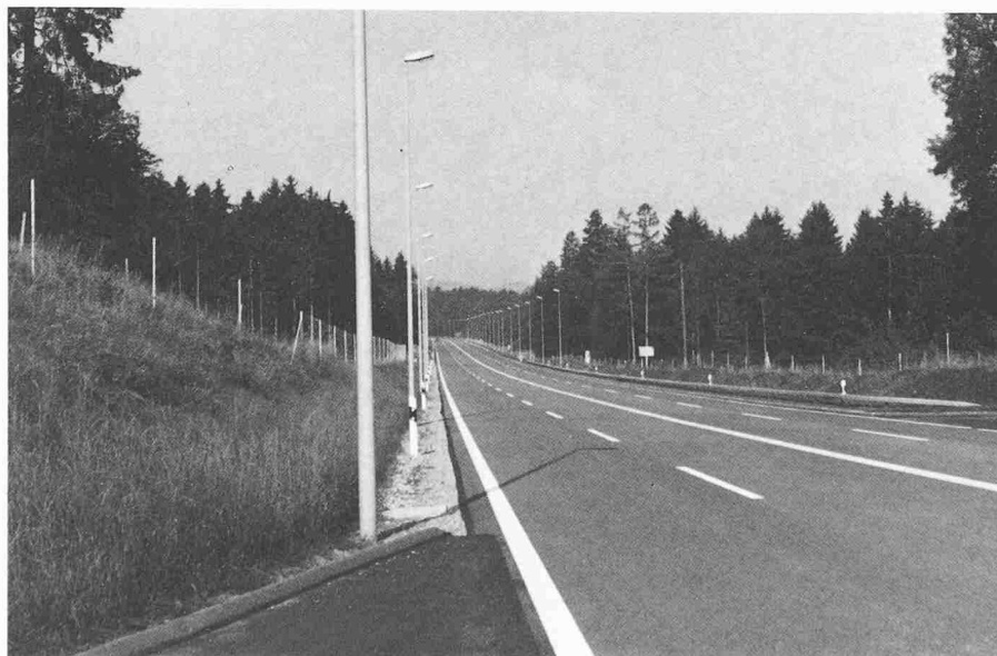
Bild 2. Anordnung der Beleuchtung auf der verlängerten Forchstrasse, Lichtpunkthöhe 12 m, Lichtpunktstand 30 m

Bei Planung und Bau der Strassen wurde dem Umwelt- und Immissionsschutz grösste Aufmerksamkeit geschenkt. Über weite Strecken ist die Strasse im Einschnitt geführt und, wo immer möglich, sind Lärmschutzdämme geschüttet worden. Als Weiterführung dieser Planungspolitik wurde auch für die Strassenbeleuchtung eine möglichst umweltfreundliche Lösung gesucht und gefunden. Basis für die Projektierung bildeten die grundlegenden Forderungen, die heute an eine moderne Strassenbeleuchtung gestellt werden: