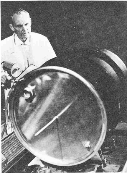
Der Erfinder des «Wärmefasses», Carlyle S. Herick, bei einer Temperaturmessung am Versuchs-Wärmespeicher. Die Warmluftgebläse links und rechts im Bild simulieren die Sonnenwärmezufuhr. Der dünne Stab in der Fassmitte ist die «Impfstelle» zur Auslösung des Gefriervorgangs, der die gespeicherte Wärme freisetzt

eines 750-Liter-Drehzylinder-Systems geplant, gebaut und getestet werden. Es wird die Grundlagen für den Bau eines Drehzylinders von kommerzieller Grösse liefern.