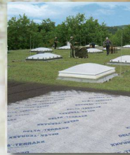
DELTA-TERRAXX Hochwertiges Schutz- und Drainagesystem

Wer optimale Flächendrainung und perfekten Grundmauerschutz anstrebt, kommt an den DELTA ® -Noppenbahnen aus dem Hause Dörken nicht vorbei. Für alle Objekte im Hoch-, Tief- und Ingenieurbau bieten sie eine hohe Sicherheit vor Feuchtigkeit. Von der Standard- bis zur innovativen High-Tech-Anwendung: Das DELTA ® -Noppenbahn-Programm ist so vielseitig wie Ihre Anforderungen. Die Dörken-Experten beraten Sie gern persönlich, welche Bahn für Ihr nächstes Projekt massgeschneidert ist. Vereinbaren Sie gleich einen Gesprächstermin!