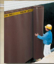
DELTA-MS Sauberkeitsschicht, Grundmauerschutz und Sickerschicht