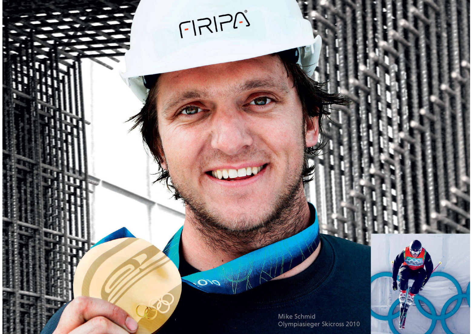
Mike Schmid Olympiasieger Skicross 2010