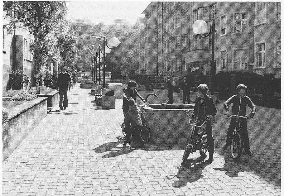
Ein Ansatz: Die Laufenstrasse in Basel

«Weil es an Schlaf fehlt, gehen in Rom viele Kranke zugrunde», schrieb schon Juvenal. Wir haben es nicht viel weiter gebracht. Von alten ägyptischen Darstellungen wissen wir, dass die Stadtbewohner den Eindringlingen und Eroberern ihre Kinder als Versöhnungsgaben anboten. Wenn wir unsere Unfallstatistiken betrachten, stellen wir mit Entsetzen fest, dass auch wir offenbar bereit sind, den modernen Stadteroberern und Stadterstörern unsere Kinder als Opfer zu überlassen.