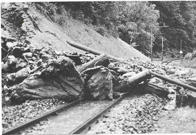
Bild 4. Mit Baumstämmen, Felsbrocken und Geröll hat der Husergraben-Bach bei Lungern 1986 das Bahngleis verschüttet