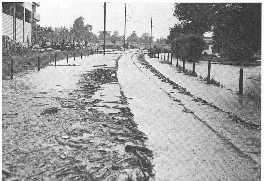
Bild 3. Das überschwemmte Trasse der Brünigbahn nach dem schweren Unwetter von 1984 in Sachseln

Narben in der Baumrinde sprechen eine deutliche Sprache. Herumliegende Felstrümmer deuten darauf hin, dass der Felsrutsch vom 8. September 1986 oberhalb Giswil sich mit einer in geologischen Zeiträumen wiederholenden Periodizität ereignet. Neben den Steinschlägen sind aber auch Zonen mit deutlich messbarem Kriechverhalten, wie etwa das Hüttstettmassiv bei Lungern, bekannte Problemgebiete.