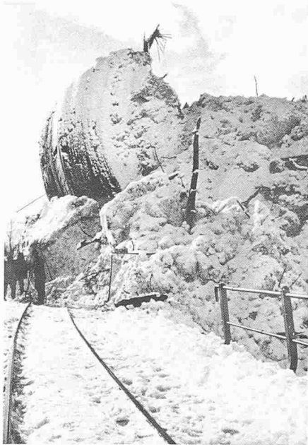
Bild 2. Die historische Photographie von der Minacheri-Lawine von 1942 gibt einen anschaulichen Eindruck von der Gewalt solcher mit Bäumen und Felsbrocken durchsetzter Nassschneelawinen