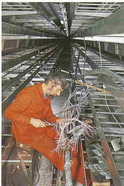
Bild 3. Monteur beim Spleissen eines Fernmeldekabels 100 \times 4 \times 0,6 im Kabelstollen

Die grosse Massierung von Kabeln im Bereiche des Zentralstellwerkes, des Dienstgebäudes-West und teilweise in den Perrons erforderte den Neubau eines grossen Kabelhaupttrasses. Dazu wurden drei Vergleichsstudien ausgearbeitet: