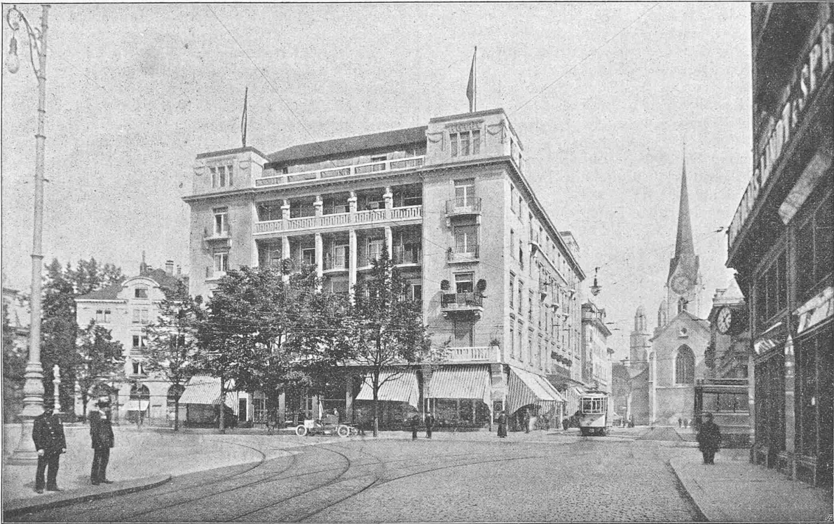
Abb. 2. Ansicht des umgebauten Hotels vom Paradeplatz aus.

Tafel I: Umbau des Hotel Baur en ville in Zürich.