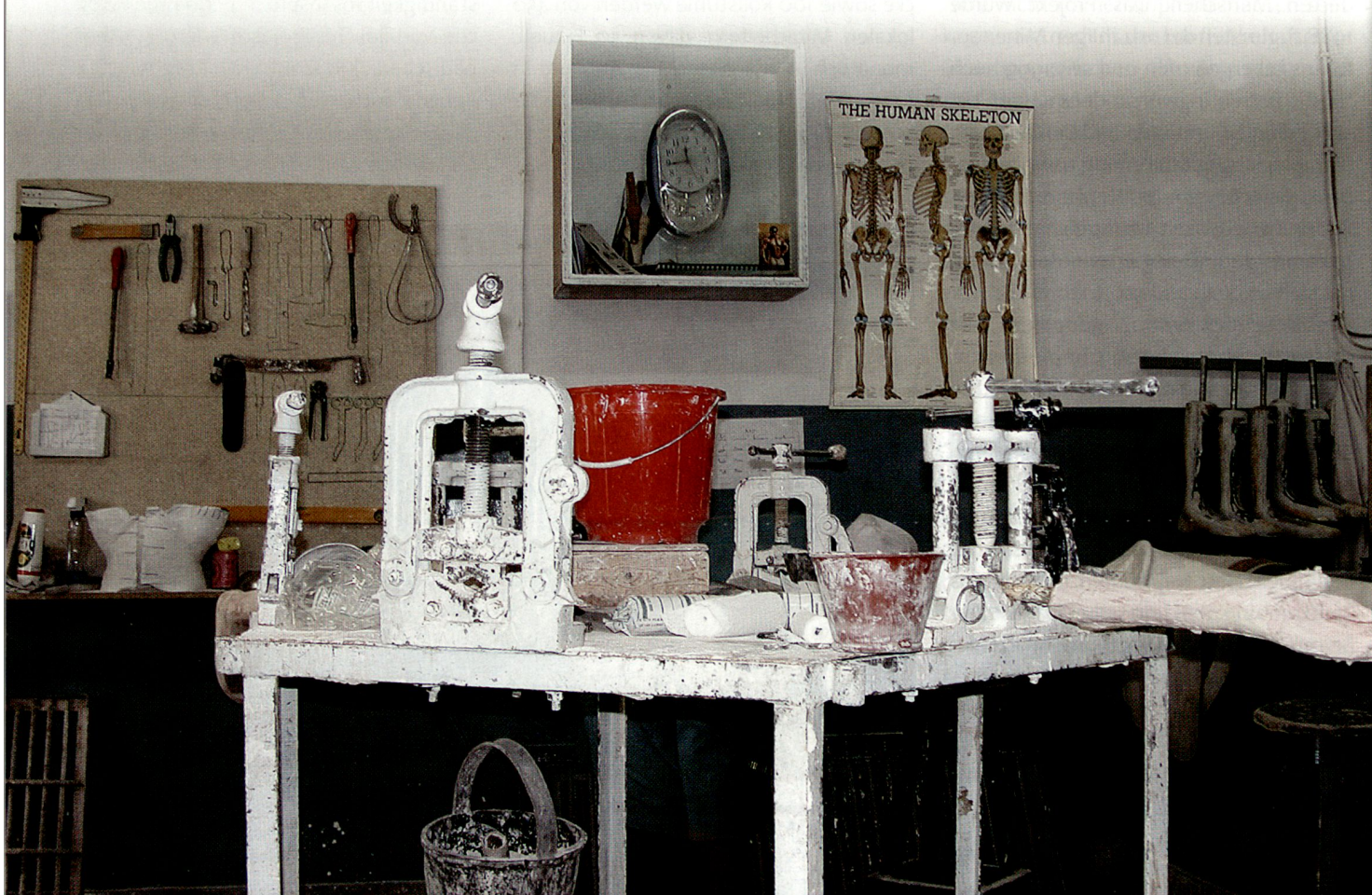
Blick in die Orthopädiewerkstatt des IKRK.

Bedauerlicherweise sind die auffällig gekennzeichneten Geländefahrzeuge internationaler Hilfsorganisationen, welche in grosser Zahl auf den wenigen befahrbaren Strassen des Landes anzutreffen sind, für die Bevölkerung Afghanistans leichter erkennbar als die Früchte deren Arbeit und Präsenz. ■