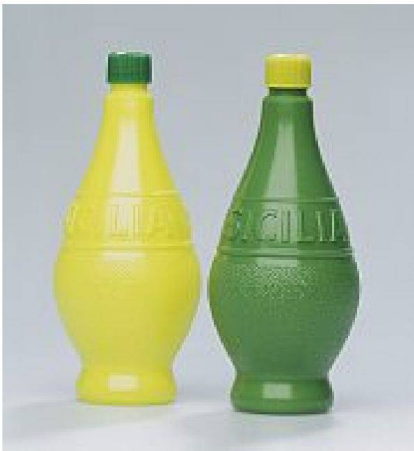
Die Form vermittelt den Inhalt und lässt sich wie das Original auspressen