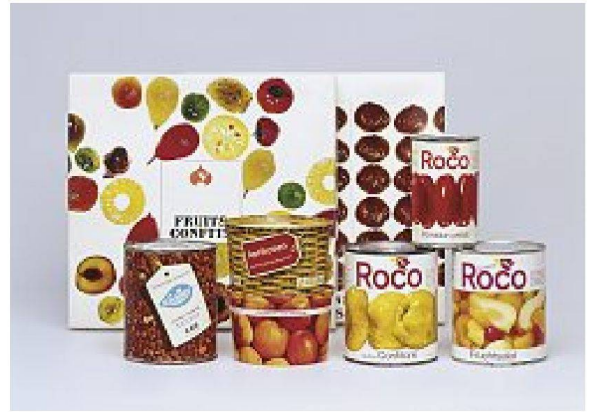
Transparenz in den 60er Jahren: ehrliche Information, als wäre die Verpackung aus Glas