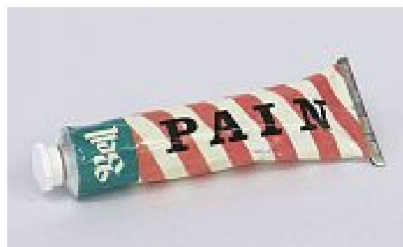
Möglichst weit weg vom Ursprung durch absolute Abstraktion von Inhalt und Form