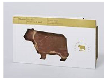
Eine elegante Lösung für die Präsentation von einem Stück Beef