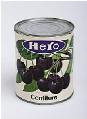
Hero Konservendose aus den 30er Jahren: Der Stiel ist noch dran