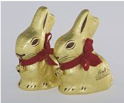
Der Goldhase: in die Form des Überbringertiers gegossen

sofort erkennbar und erinnern sogar in der Anwendung ans natürlich gewachsene Original. Eine grosse Formenvielfalt findet sich auch in der Geschichte der Schokoladenverpackungen. Bis heute im Handel sind die beliebten Hasen im Goldmantel (Entwurf 1952, Linth & Sprüngli AG, Kilchberg). Nur vermittelt die Hasenform keine Informationen über Herkunft oder Qualität der verwendeten Schokolade. Anders als die Schokoladenmarke Milka, die mit einer Lila Kuh wirbt, giesst Lindt ihr Produkt in die Form eines wirklich phantastischen Tiers: des Osterhasen als Überbringer des süssigen Geschenks. Das ist beinahe so, als wollten sich Würste in der Form eines Jägers verkaufen.