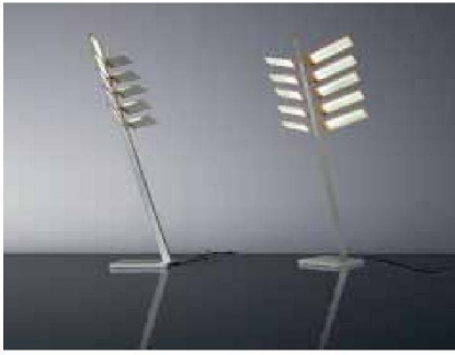
«Early Future» von Ingo Maurer mit organischen LED