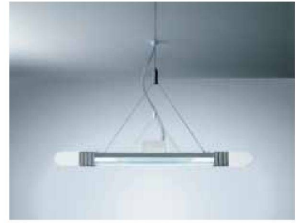
Bürobeleuchtung «Aero II Hybrid» von Zumtobel

rung am Arbeitsplatz geht. Schon heute sind LED-Lichtmanagement-Systeme möglich, die das sich verändernde Tageslicht in Räumen simulieren, um Müdigkeitserscheinungen zu reduzieren.