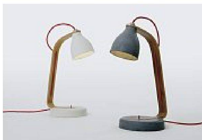
Tischleuchte «Heavy Desk Light», Design: Benjamin Hubert für Decode

An der diesjährigen «100% Design» anlässlich des London Design Festivals sorgte der junge britische Designer Benjamin Hubert mit einer neuen Tischleuchte für Aufmerksamkeit. Fuss und Lampenschirm von «Heavy Desk Light» sind aus handgegossenem Beton gefertigt, der Arm besteht aus Formsperrholz, während das rot verkleidete Stromkabel sichtbar zur Steckdose führt ist. Das Design der Tischleuchte ist zeitlos klassisch, die Materialien sind roh und «low-tech», die Konstruktion nachvollziehbar simpel. Bereitwillig wurde dieses Produkt – wie zahlreiche andere preisgekrönte Entwürfe des jungen Briten – in den Kanon von «nachhaltigem Design» aufgenommen. Doch warum eigentlich? Was ist «nachhaltig» an «Heavy Desk Light»? Die Antwort liegt in den Argumenten, welche die Produktgestaltung bzw. Design als solches momentan bereithält, um Nachhaltigkeit auch für sich in Anspruch zu nehmen. «Am nachhaltigsten sind Dinge, mit denen wir lange leben», sagte der deutsche Designer Konstantin Grcic kürzlich in einem Interview zum Thema Green Design. «Und das setzt voraus, dass wir damit lange leben wollen. Wir pflegen und reparieren sie und haben sie gerne um uns. Das setzt voraus, dass sie angenehm sind, schön sind, funktionieren.» Das Design von «Heavy Desk Light» verspricht,