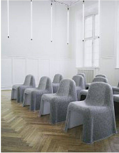
Stuhl «Nobody», Design: Komplot für HAY

sammengefügt ist: verdübelt, verschweisst, beschichtet oder verarbeitet, so dass eine Auftrennung nur schwerlich möglich ist. Um dieses Manko in Sachen Entsorgung zu beheben, setzt sich Produktgestaltung deshalb vermehrt mit dem Material als solchem auseinander, aber auch mit der Materialökonomie (Reduktion der verwendeten Materialien und Bestandteile) sowie dem Herstellungsprozess.