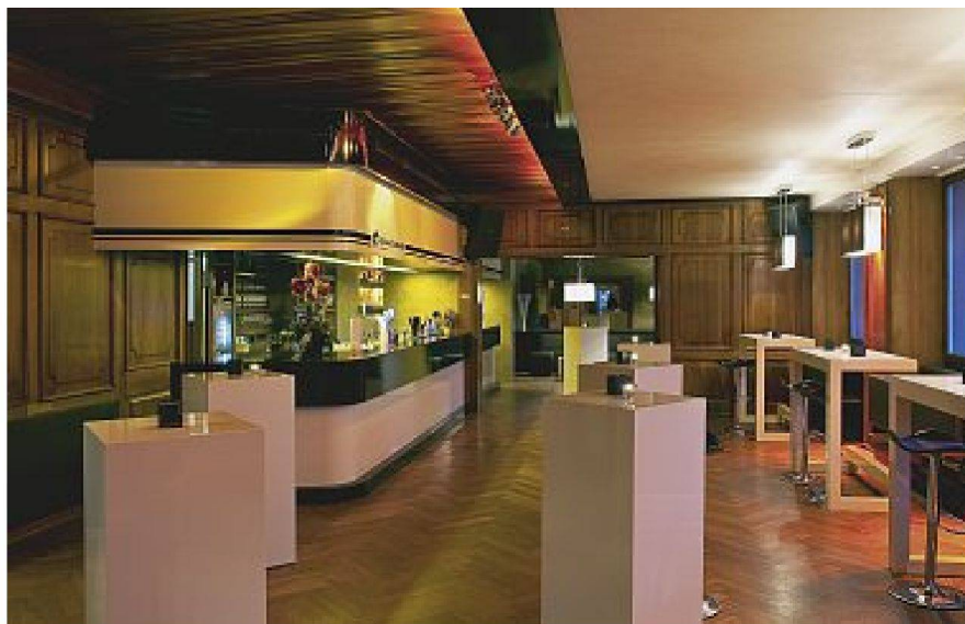
Acht Meter lange, verbindende Theke