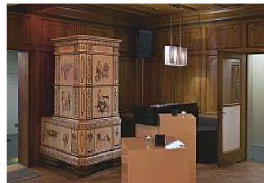
Reminiszenz an die Vergangenheit

sowie zwei Spiegel mit opulentem Rahmen. Zum anderen sind es pragmatisch gelöste Ergänzungen, die sich im Lauf des Betriebs aufdrängten. Dies betrifft vor allem die Beleuchtung. Scheinwerfer wurden an den Seitenwänden und unter der eingezogenen Decke ergänzt und – was erstaunt – Spots in den alten, hölzernen Torbogen eingelassen, der eine wunderbare Sitznische mit tiefem Rundfenster vom Hauptraum abtrennt. Neben diesen verschiedenen neuen Eingriffen bleibt der historische Kachelofen beim Eingang eines der auffälligsten Elemente. Seine Präsenz ist ambivalent: Einerseits erinnert er würdevoll an die Vergangenheit des Lokals, andererseits bildet er als einziges freistehendes, altes Element einen Fremdkörper in der sonst neuen Möblierung. Genau diese Collage, diese Lesbarkeit der Zeiten, Stile und Ansprüche machen die Spannung der Archbar aus. Die neue Kombination – inklusiv der Ergänzungen der Betreiber – verleihen der Bar etwas