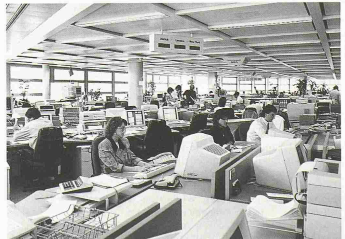
Im neuen Gebäude untergebracht: Börsenhandelsraum der SBG