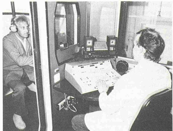
Aufnahme der Hörkurve mit dem Audiometer im Audiomobil der SUVA

Hören Sie gut? Prüfen Sie Ihr Gehör mit dem SUVA-Telefonhörtest! Tel. 041/40 45 11 (deutsch)