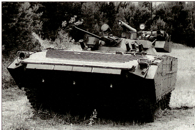
Kampfwertgesteigerter Schützenpanzer BMP-2.

Auch beim Kampffahrzeug BMP-3, der über eine Doppelbewaffnung 100-mm-Kanone und 30-mm-Automatenkanone verfügt, sind verschiedene Versionen mit merklich verbessertem Schutz vorgestellt worden. Das kürzlich gezeigte Kampffahrzeug verfügt