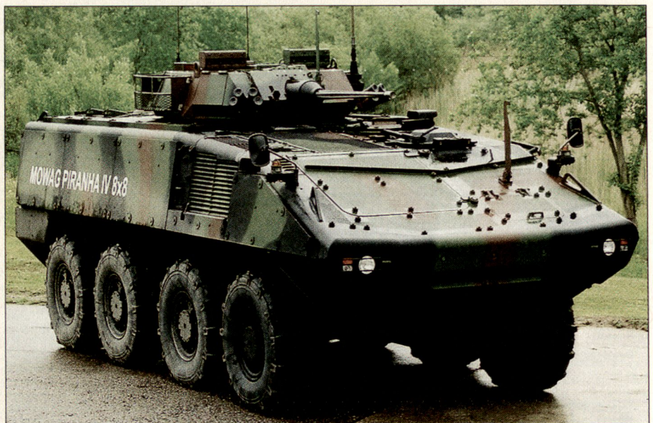
PIRANHA IV 8x8 mit 25-mm-Waffensystem.

Oberstes Ziel jeder Weiterentwicklung im Bereich Minenschutz ist es, der Besatzung eine möglichst grosse Chance zu geben, ihr Fahrzeug nach einem Unfall mit einer Blastmine unverletzt zu verlassen. Die Minenschutzlösung soll Sprengstoffmassen (Blastminen) von bis zu 8 kg TNT unter dem Fahrzeugboden abdecken, wobei das System ein Aufwuchspotenzial für zukünftige Bedrohungen besitzen soll. Jedes System soll zudem bezüglich Leistungsfähigkeit, Gewicht und Kosten ausgewogen sein. Modulare Lösungen erlauben dem Kunden die schrittweise Beschaffung und die Nachrüstung bestehender Fahrzeuggenerationen bis hin zu zukünftigen Schutztechnologien.