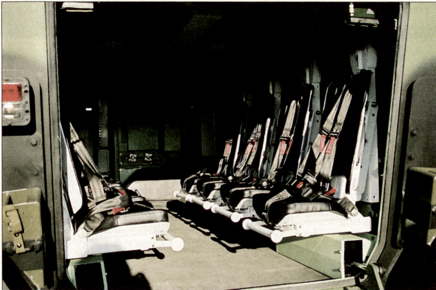
Innenansicht PIRANHA IV mit speziellen Minenschutzsitzen.