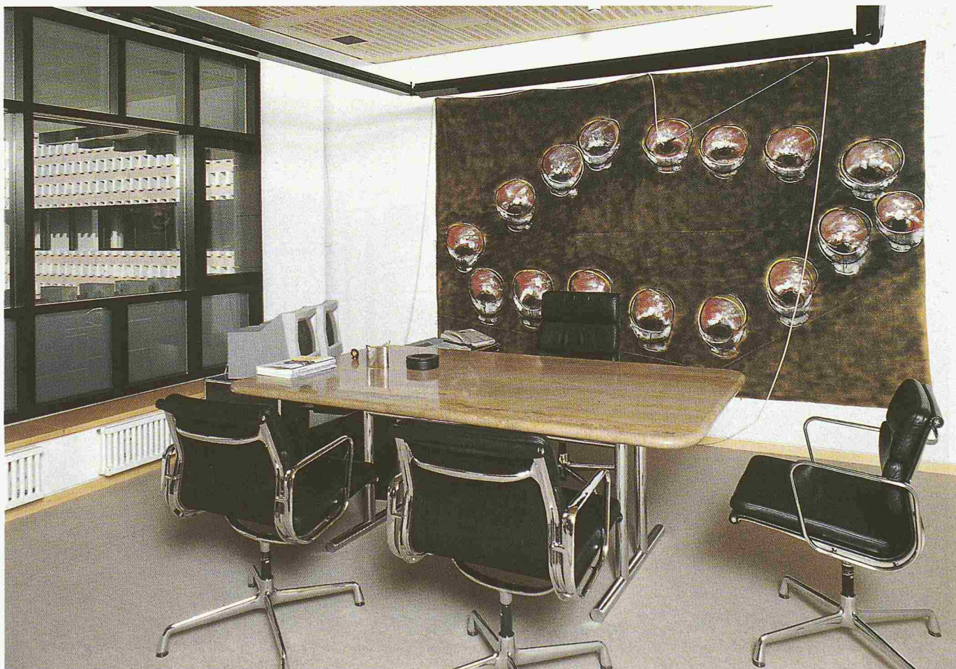
Dominierend in einem Direktionsbüro: die «Tazze die Torino» von Mario Merz