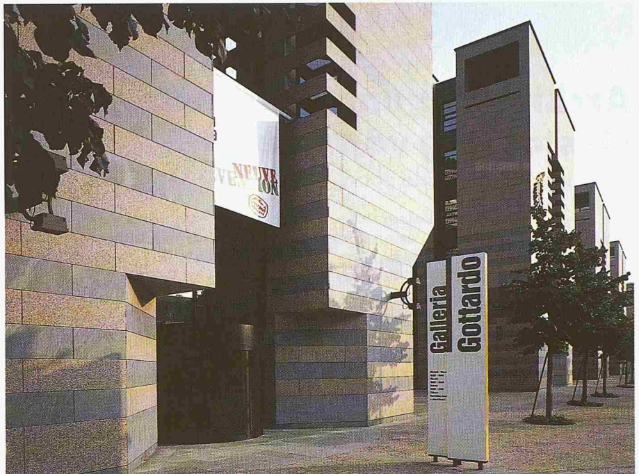
Der Eingang zur «Galleria Gottardo», die im Erdgeschoss des Bankhauses in Lugano zu finden ist

Adresse des Verfassers: Dr. C. von Castelberg, Gotthard Bank, Färberstr. 6, 8008 Zürich.