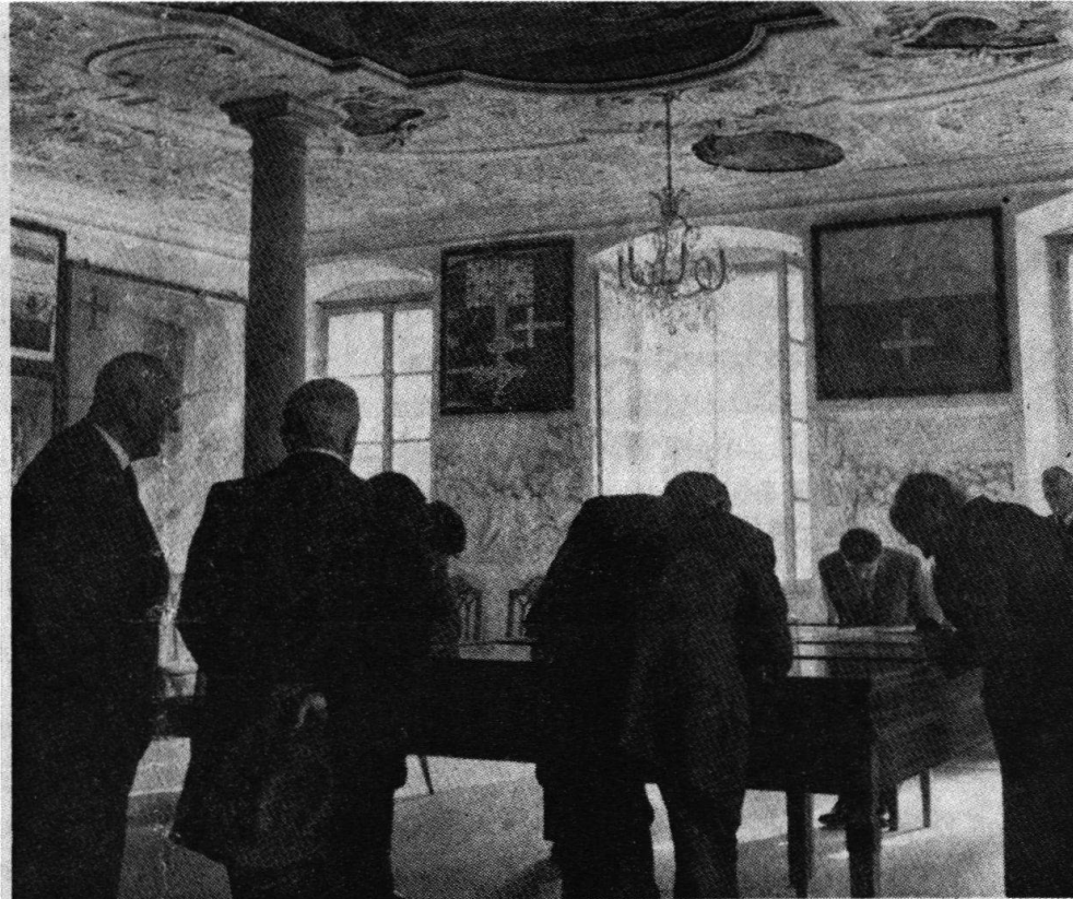
Der Pannersaal des Rathauses in Stans beherbergte für zwei Tage die der Gemeinde Stans legierte Sammlung Schweizer Münzen und Medaillen.