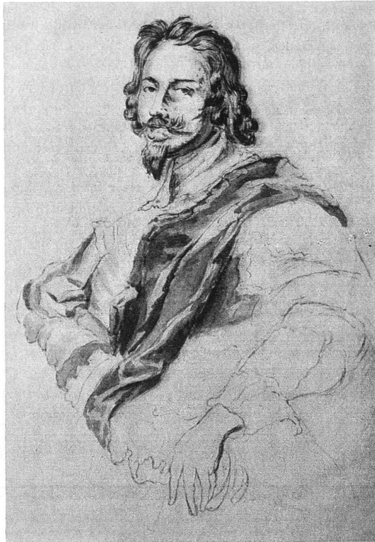
Abb. 4. Jakob Joseph Müller. Kopie nach van Dycks Porträt des Nicholas Lanier

Müller sein Monumentalbild in Dreibrunnen wie ein Tafelgemälde komponiert hat. Der Entwurf dazu zeigt tatsächlich einen illusionistisch gemalten, geschweiften Rahmen, den er offensichtlich aber erst nach der Vollendung des eigentlichen Gemäldes ihm wie eine Blende vorgesetzt hat. Einzig am untern Rand quillt das Schlachtengetümmel aus dem Rahmen, ein Kunstgriff, der dann in der Ausführung unterblieb. Das Fresko übertrifft alle übrigen Deckengemälde Müllers an Ausgewogenheit des Bildbaus so sehr, daß auch aus dieser Sicht eine fremde Vorlage angenommen werden muß. Die Farbigkeit ist ziemlich schwer, rotbraun und ocker sind vorherrschend. Dagegen finden wir in Mörschwil eine luftige Palette heller Farben, und was die Froschperspektive angeht, so ist sie durchaus korrekt gegeben. Verschiedene Züge weisen darauf hin, daß der Maler Wien gesehen hat: die Taufe Jesu scheint in Franz Anton Maulpertschs gleichthematischem Fresko in der Aula der Alten Universität in Wien vorgebildet, aus dem sogar Lichteffekte entlehnt werden. Der Wolkenstrudel um Gottvater gemahnt eher an Franz Joseph Spiegler. Es wäre wohl etwas viel verlangt, wollte man Müllers Wien-Aufenthalt, bei aller Anerken-