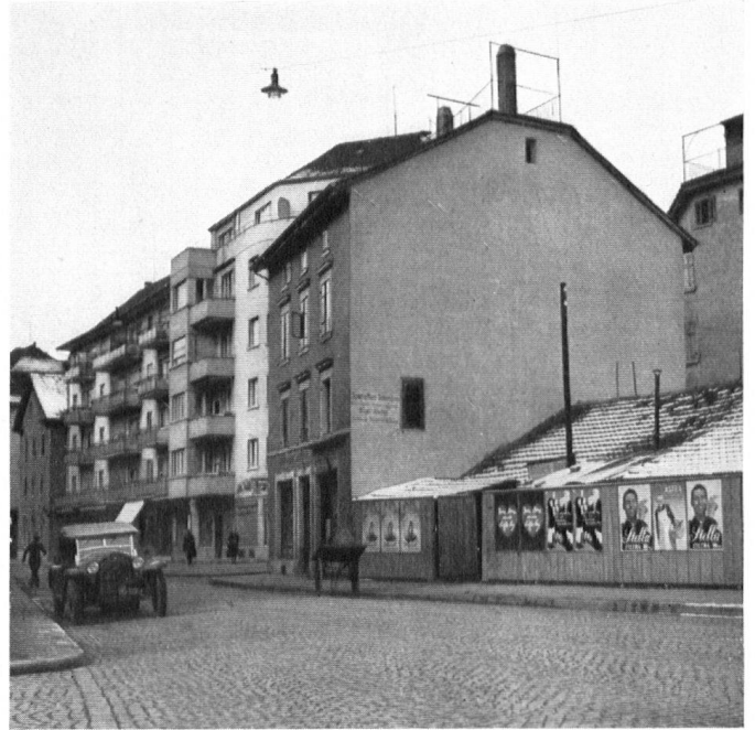
Bilder oben: Die VIM-Reklame in Zürich ist prompt übertüncht worden. En haut: La fâcheuse inscription VIM vient de disparaître de la façade zuricoise. In alto: La reclame del VIM a Zurigo à scomparsa in men che non si dica.