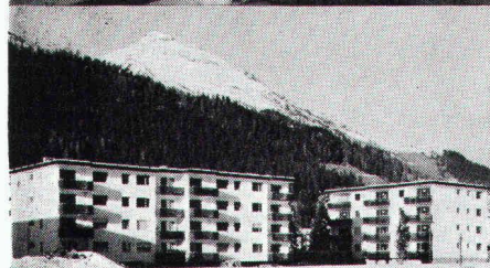
Überbauung Rietstrasse, Elektrizitätswerk der Landschaft Davos; total 33 Wohnungen; Anschlusswert ca. 400 kW

Überbauung Meiliboda 2, Elektrizitätswerk Arosa; total 30 Wohnungen; Anschlusswert ca. 380 kW