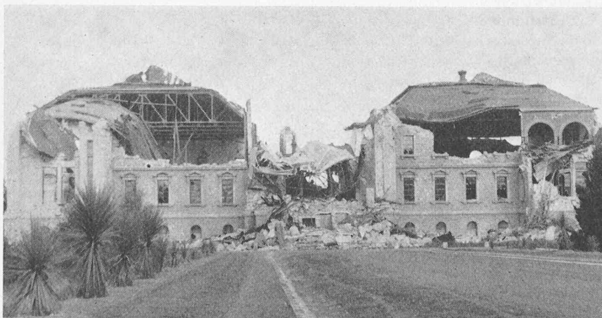
Hauptbibliothek der Stanford Universität nach dem Erdbeben von San Franzisko im Jahre 1906

Seine einführenden Worte galten der Entwicklung des Erdbebenbauwesens, das nach dem Erdbeben von San Franzisko im Jahre 1906 begann. Er gab den Teilnehmern einige Eindrücke, wie die Forschung auf diesem Gebiet aussah zu einer Zeit, da es noch keine hochentwickelten Rechenanlagen gab und wo wirtschaftlich denkende Verwalter den Wert solcher Forschung unterschätzten, was er mit folgendem Zitat belegte: «Because after one earthquake has been recorded, why bother to record more!» In diesem Zusammenhang widmete er einige