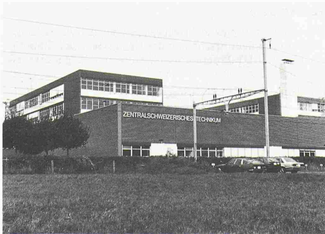
Das Zentralschweizerische Technikum in Horw

Die Festansprache an der ZTL-Feier in Luzern vom 28.10.88, gehalten von Herrn Walter von Moos zum Thema «Ethik und Verantwortung in einer technisierten Welt», wird in einer der kommenden Nummern des Schweizer Ingenieur und Architekt veröffentlicht.