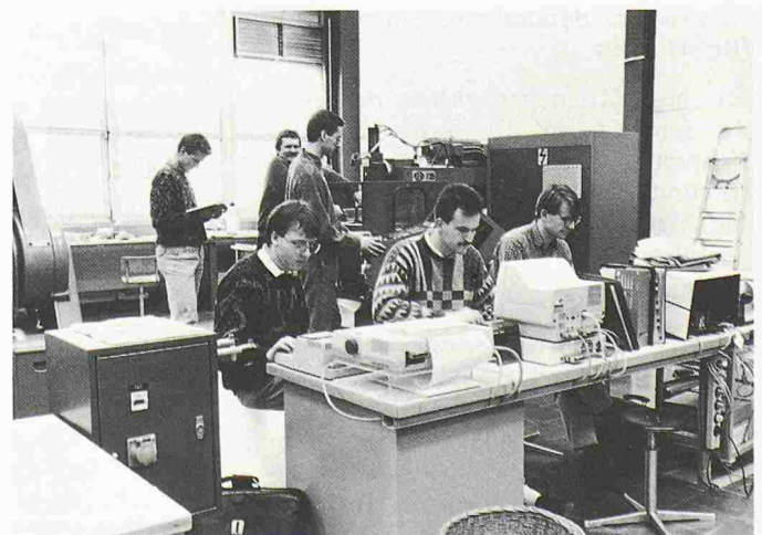
Informatikausbildung im Werkzeugmaschinen-Labor des ZTL