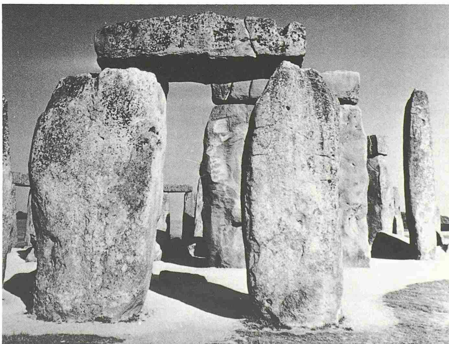
Durch Gesteinsanalysen antiker Monumente konnten zum Teil fast unglaubliche Transportwege bewiesen werden. Die über 6 m hohen Monolithe von Stonehenge in Südengland wurden im 3. Jahrtausend v. Chr. über 200 km antransportiert

Dass ein analytischer Herkunftsnachweis nicht immer zuverlässig ist, zeigen zwei Beispiele aus dem Bereich der Keramikanalyse. Keramiken lassen sich aufgrund der grossen Zahl aktivierungsanalytisch bestimmbarer Spurenelemente recht genau lokalisieren. Bei der Analyse einer Terra-Sigillata-Keramik, die in römischer Zeit als Tafelgeschirr sehr geschätzt war, zeigte sich, dass sie nicht aus der berühmten und