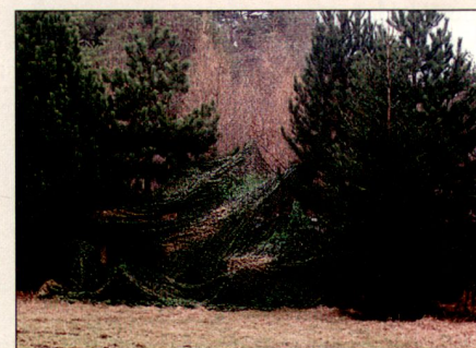
Ein M113 mit Tarnnetz in einer Waldlichtung.

In Europa wird der multispektralen Tarnung deshalb von wehrwissenschaftlicher Seite viel theoretisches Interesse entgegengebracht. Dieses Interesse mündet jedoch erst wenig in konkrete Beschaffungsentscheidungen. Im Rahmen der Beurteilung durch verschiedene internationale wehrwissenschaftliche Gremien in multinationalen Messkampagnen, durchgeführt durch Truppen der jeweiligen Länder und deren Fachabteilungen in den Beschaffungsämtern, zeigt sich regelmässig, dass das in der Schweiz entwickelte Tarnmaterial leistungsmässig an der Spitze steht. Das durch Auftragen mehrerer unterschiedlicher, dünner Schichten aufgebaute textile Material trägt den verschiedenen Erkennungssensoren in den spezifischen Wellenlängenbereichen Rechnung. Einerseits ist das Material dank einer patentierten wellen-