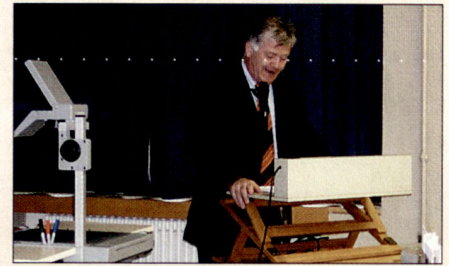
Ständeratspräsident Bruno Frick.

Macht vor Recht erkennbar. Dies gilt auch für die Philosophen Thomas Hobbes (1588–1697) und Baruch de Spinoza (1632–1677). Wesentlich für das Verständnis des Begriffes «Macht» in der Gegenwart seien die Analysen und Interpretationen des Soziologen Max Weber. Weitere Beiträge zur Begriffsbestimmung stammen von Sigmund Freud, Hans J. Morgenthau und Niklas Luhmann. Bis heute sei aber die Frage nicht entschieden, ob «Macht» vor «Recht» oder «Recht» vor «Macht» zu setzen sei.