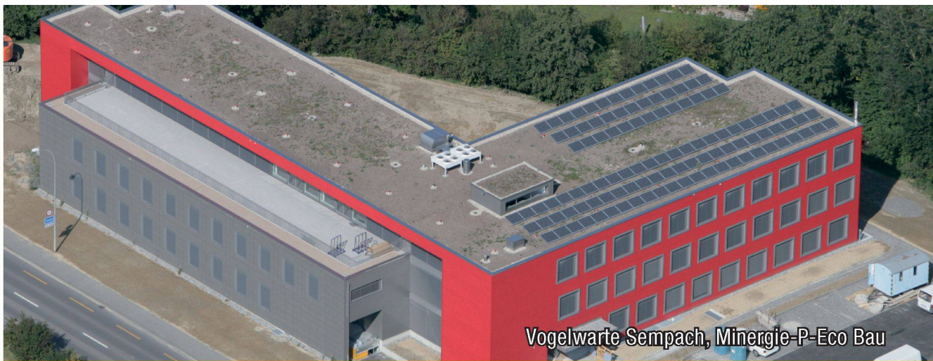
Vogelwarte Sempach, Minergie-P-Eco Bau