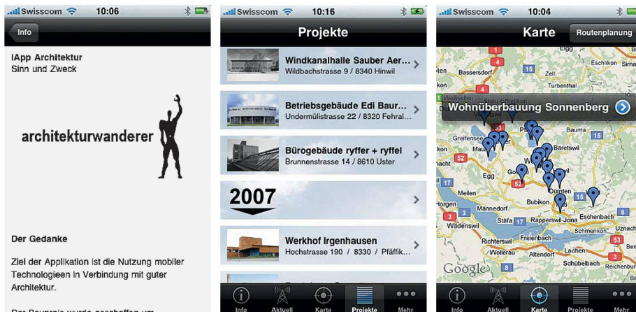
01 «Architekturwanderer» – eine iPhone-App zur Erkundung des Zürcher Oberlandes

Interessante Architektur gibt es auch ausserhalb von Zürich – die kostenlose iPhone-Applikation «Architekturwanderer» des Architekturforums Zürcher Oberland (AFZO) zeigt nicht nur wo.