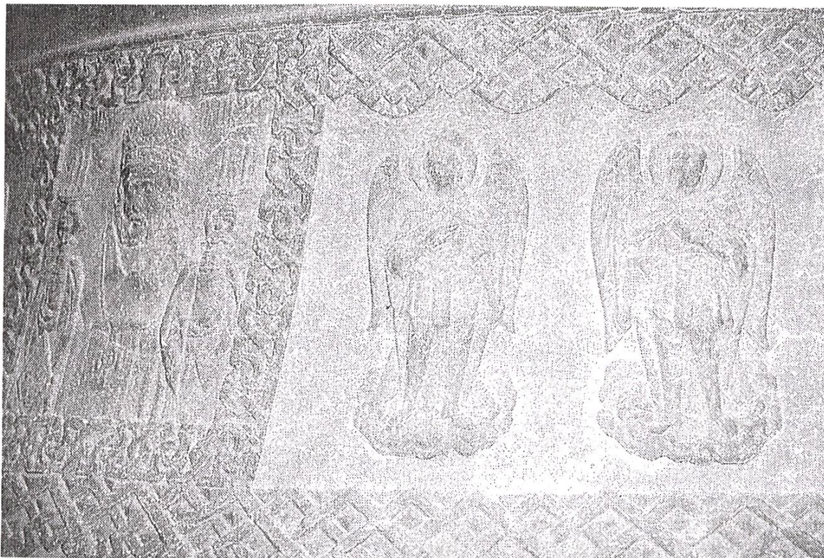
Cloche / Glocke 4