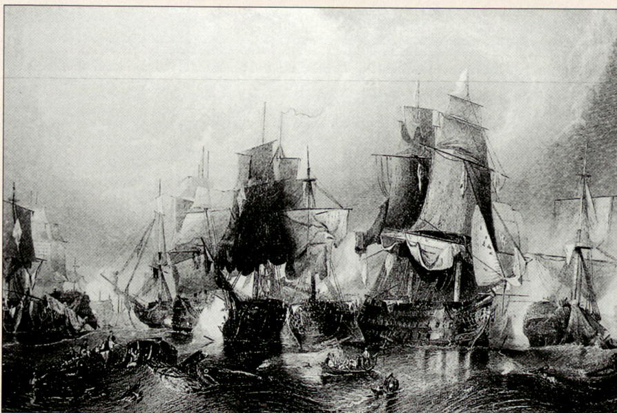
Mit Charisma zum Sieg: Die Seeschlacht bei Trafalgar 1805.

Captain Aubrey ist wie die meisten charismatischen Führer ein Original, ein eigenwilliger Kopf, ein kühner Held und Draufgänger – geboren zum Handeln, nicht zum Gehorchen. Er hat den Befehl, die «Acheron» bis zur Küste Brasiliens zu verfolgen, denkt aber gar nicht daran, die Jagd abzubrechen, nachdem er die Grenze seines Operationsgebietes erreicht hat.