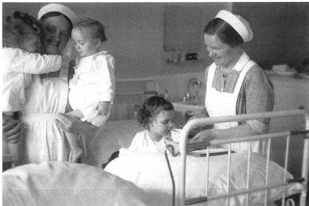
148 Abb. 9: 1944, SPZ-Schwwestern im Sanitätsdienst. Abb. 10: «21. Feb. 1940». Kinderabteilung.