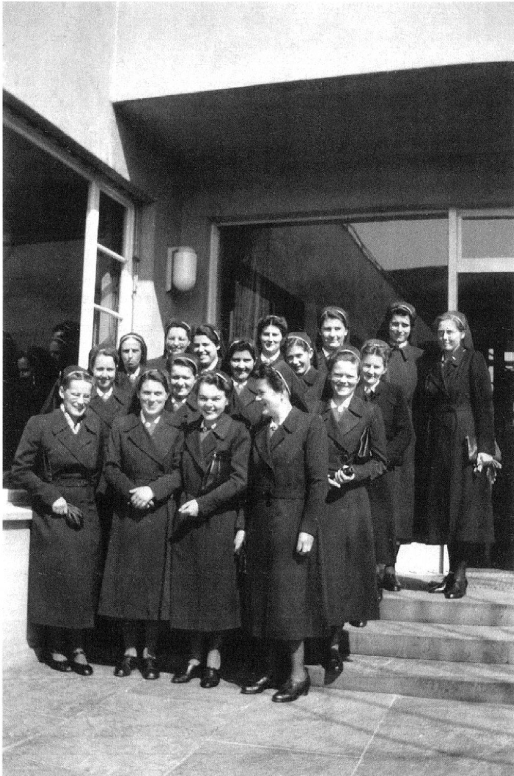
Abb. 7: «W. S. Frühjahr 1943» (Schweiz. Pflegerinnenschule mit Krankenhaus in Zürich, die Oberin). Vorkurs WS, Frühjahr 1943, Ausgangstracht.