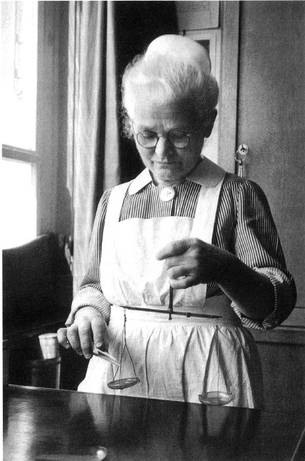
Abb. 8: «Lily». Abwägen von Medikamenten.