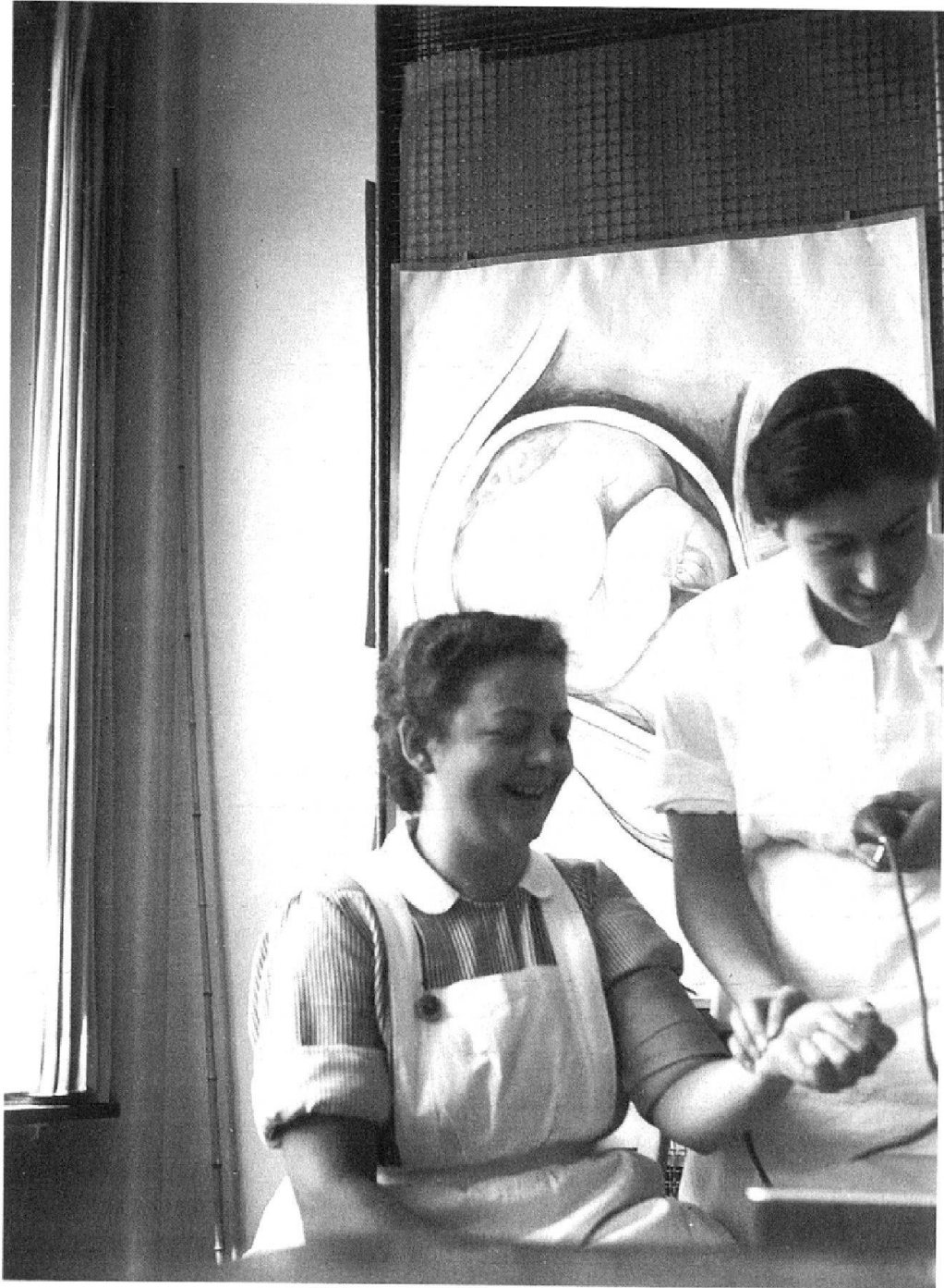
Abb. 1: «WS Fr. 1943 Praktisch» (Schweiz. Pflegerinnenschule mit Krankenhaus in Zürich, die Oberin). Vorkurs, Verbandslehre.