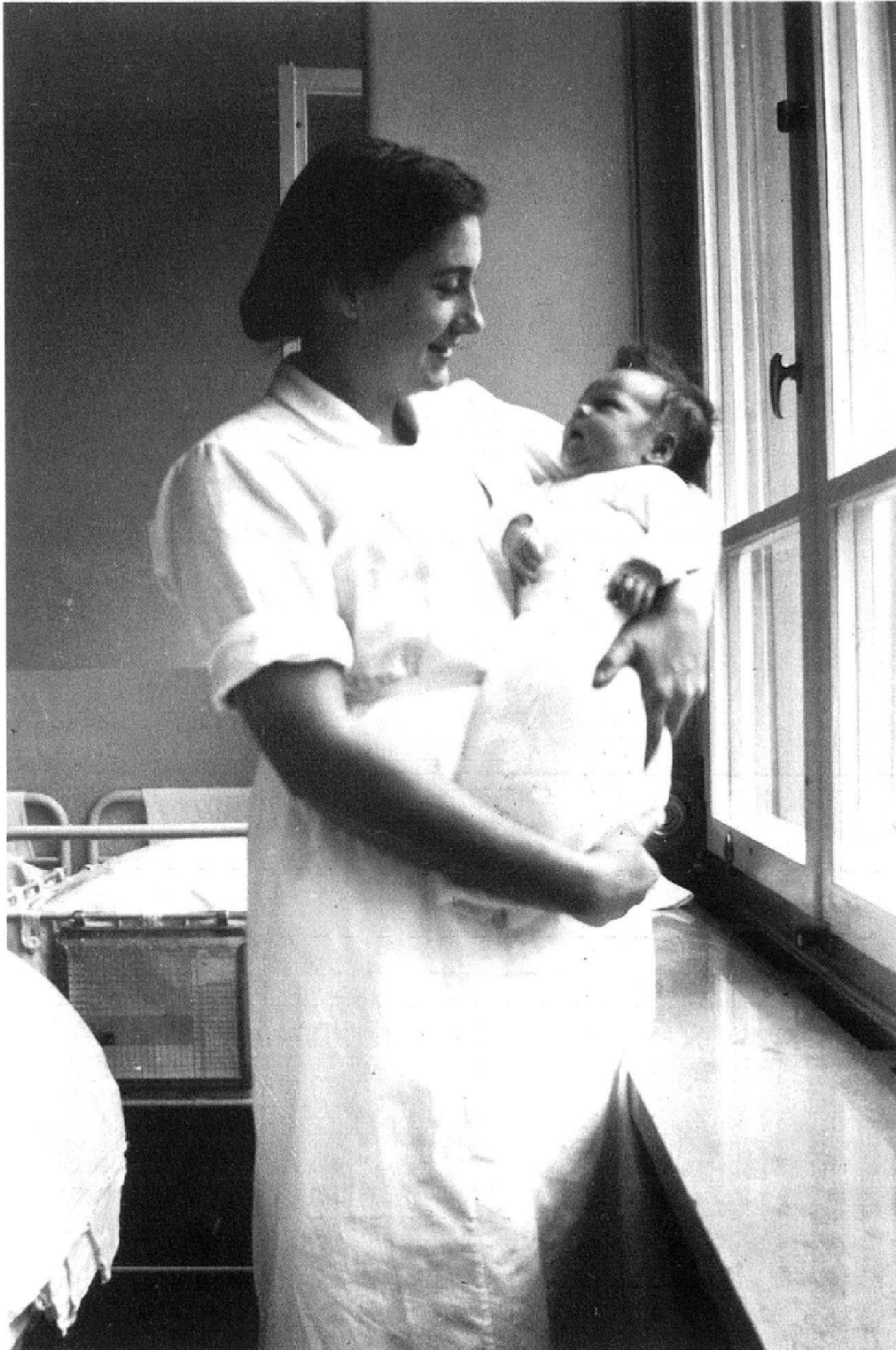
Abb. 6: «1943» (Schweiz. Pflegerinnenschule mit Krankenhaus in Zürich, die Oberin). Säuglingsabteilung.