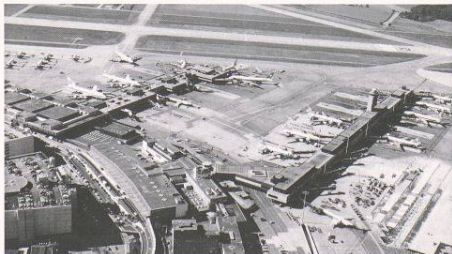
Der Terminal A des Flughafens Zürich (im Vordergrund mit dem Fingerdock auf der rechten Seite) wird von jetzt an vor allem der Swissair, der Crossair und den europäischen Allianzpartnern SAS sowie Austrian Airlines dienen