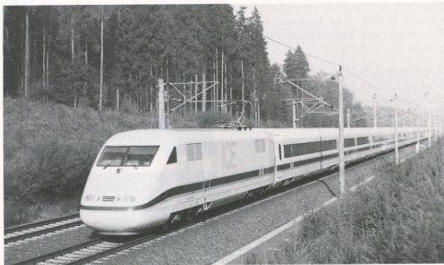
Hochgeschwindigkeitszüge sind bei den Reisenden beliebt – sei es in Deutschland, Japan oder Frankreich

verbanden die TGV-Züge zwölf Städte miteinander; zurzeit sind 36 Städte mit 26 Mio. Einwohner (43% der Bevölkerung) an das 2000 km lange TGV-Streckennetz Paris-Südost angeschlossen. Das führte zu 50% Steigerung der jährlichen Eisenbahn-Fernverkehrsleistung (11 Mia. Personenkilometer) gegenüber der Zeit vor Einführung des TGV.