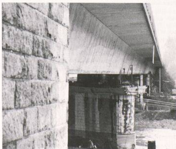
Bilder 1 und 2. Spannbetonüberbauten der Innbrücken in Kufstein über dem um 1,28 m abgesunkenen Flusspfeiler: vor (Bild 1) und nach dem Anheben in die ursprüngliche Lage (Bild 2).