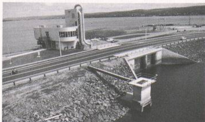
Bild 3. 20 MW-Pilotanlage Annapolis an der Bay of Fundy, Kanada. Blick vom Meer Richtung Becken; Maschinenhaus und Kommandoraum

Schleuse: 1 Kammer mit 13 m x 65 m Nutzfläche