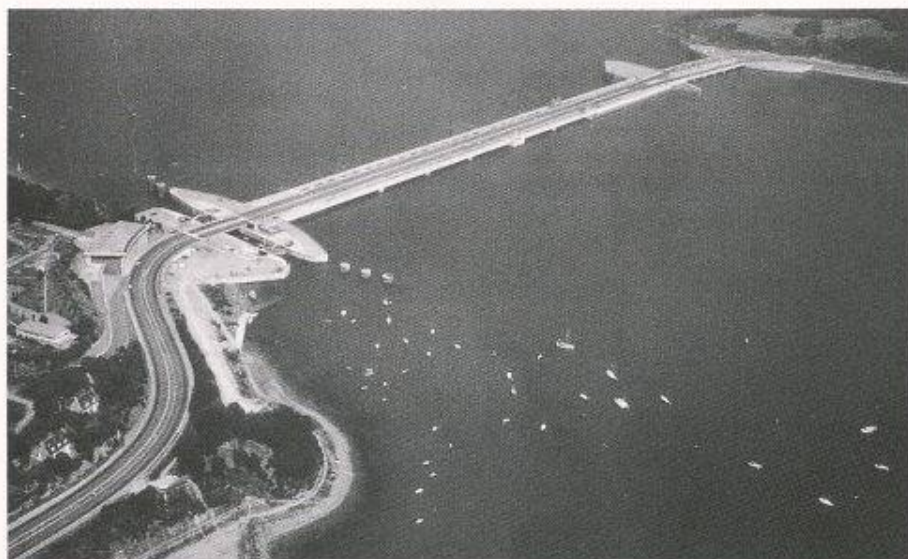
Bild 2. 240 MW-Gezeitenkraftwerk an der Rancemündung in Frankreich. Blick vom Becken Richtung Meer; links die Schiffsschleuse; in der Mitte das Maschinenhaus; rechts das Wehr