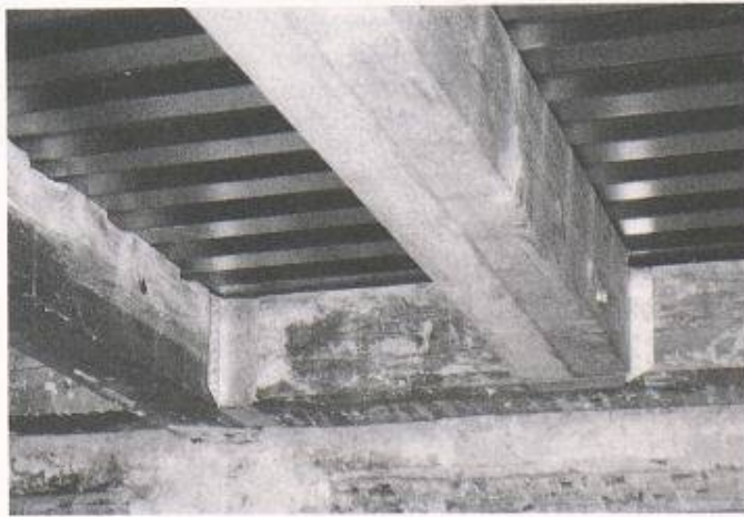
Bild 3. Holzbalken und Trapezbleche von unten gesehen