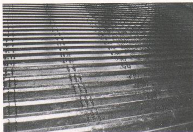
Bild 2. Trapezbleche und Verbundschrauben von oben gesehen