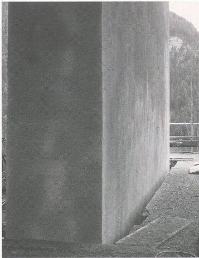
Bild 5. Grossflächige Instandsetzung eines Brückenpfeilers mit Nassspritzbeton bei hohem Chloridgehalt im Altbeton (Lukas/Kusterle)