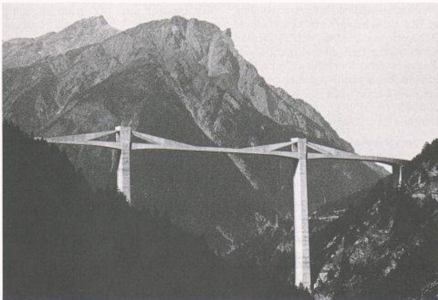
Bild 6. Ganterbrücke nach Instandsetzung des 700 m langen, salzgeschädigten Brückentroges mit Spritzbeton (Teichert)

Beschleunigern (BE) auftragen und den Rückprall gering halten kann [6]. Im Gegensatz dazu wird der silicamodifizierte Nassspritzmörtel mit Microsilica-Suspension [5] in neuentwickelter Feucht-Dünnstrom-Spritztechnik verarbeitet [10]; Schichtdicken bis zu 70 cm in einem Arbeitsgang sind damit möglich. Dieser Nassspritzmörtel ist dem instandzusetzenden Beton gut angepasst, denn Temperaturausdehnungskoeffizient und hygriertes Quellmass entsprechen weitgehend denen des Betons; er ist wegen seiner Dichtigkeit gut für Instandsetzungen bei starken Umwelteinflüssen (aggressive Gase, Wasser und Böden) geeignet.