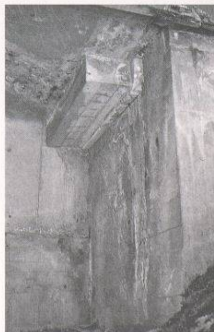
Bild 3. Autobahnbrücke mit starken Salzsäuren im Bereich der Pfeiler (Lukas/Kusterle)