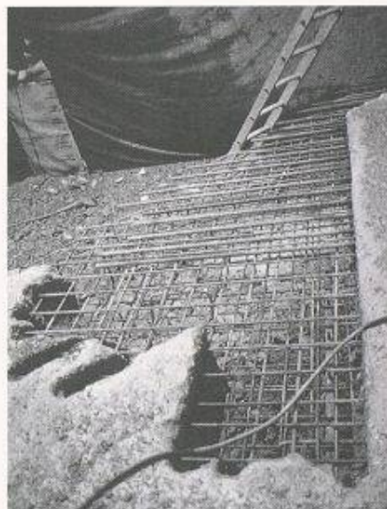
Bild 2. Betonteilausbruch mit Hochdruckwasser ohne Schädigung der Bewehrung (Rosa)

Bei der «Reparatur von Salzsäuren an der Ganterbrücke» (Teichert) 1054 m ü. NN, auf der Nordrampe des Simplon-Passes im Oberwallis (Bild 6), war durch einen Fehler der Fahrbahn-Enteisungsanlage der Boden des 700 m langen Brückentrog (9,00/2,50–5,00 m) versalzt worden. Zur Instandsetzung wurden 50 m 3 Beton auf 1400 m 2 2–9 cm tief zum Teil bis hinter die Bewehrung abgetragen und anschliessend 75 m 3