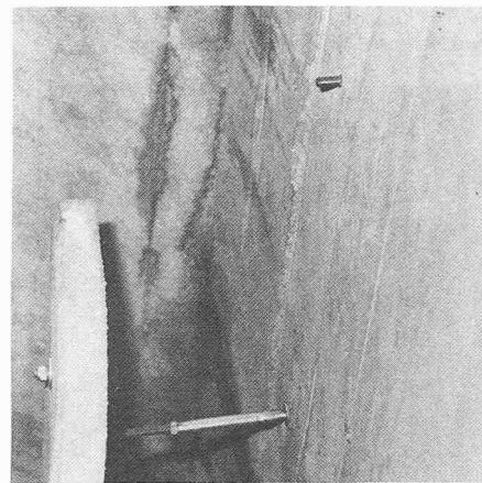
Bild 3. Verkleidungsplatten. Die Tunnelverkleidung aus vorfabrizierten Betonelementen wurde unten abgestellt und oben dann mit zwei speziellen Halteplatten und Klebeankern aus rostfreiem Stahl fixiert

Einige Beispiele von Befestigungen im Gotthardtunnel sind in den Bildern 1 bis 3 dargestellt. Es ist unmöglich, alle diese Befestigungsarten umfassend zu beschreiben, weshalb wir nur ein Gebiet, die Isolationsbefestigung , detailliert erläutern wollen.