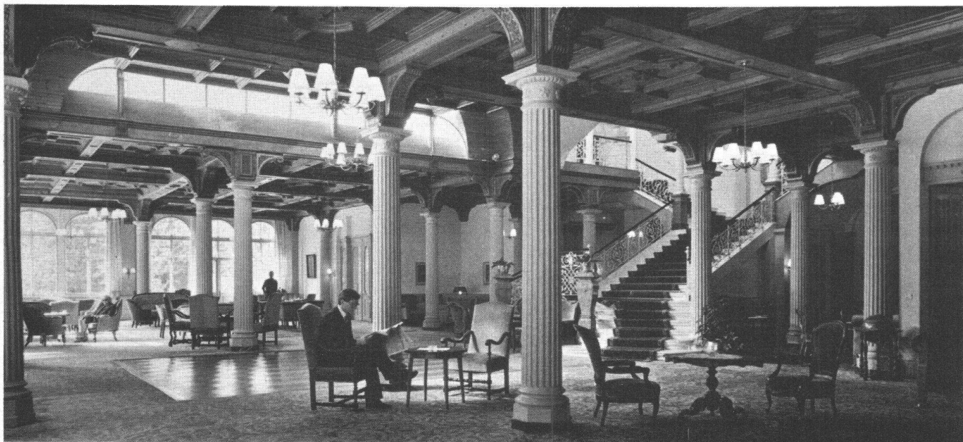
L'incomparable ambiance des anciens hôtels – comme ici au «Waldhaus» de Vulpera – sera-t-elle bientôt sacrifiée à l'uniformisation universelle pour appartenir à l'histoire?