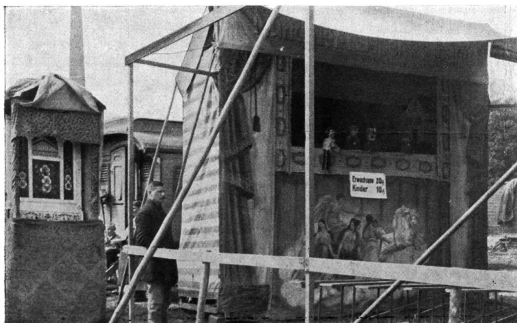
Kasperltheater Hans Birkenmeier, München.